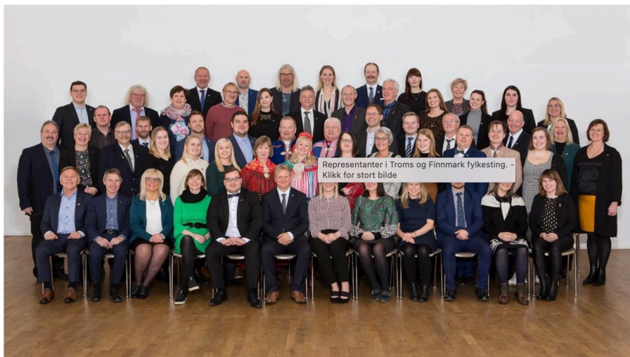
Representanter i Troms og Finnmark fylkesting. - Klikk for stort bilde