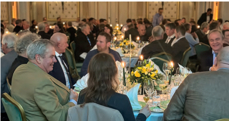
Jubileumsmiddag på Hotel Bristol, der omtrent 120 personer fra hele bransjen deltok.