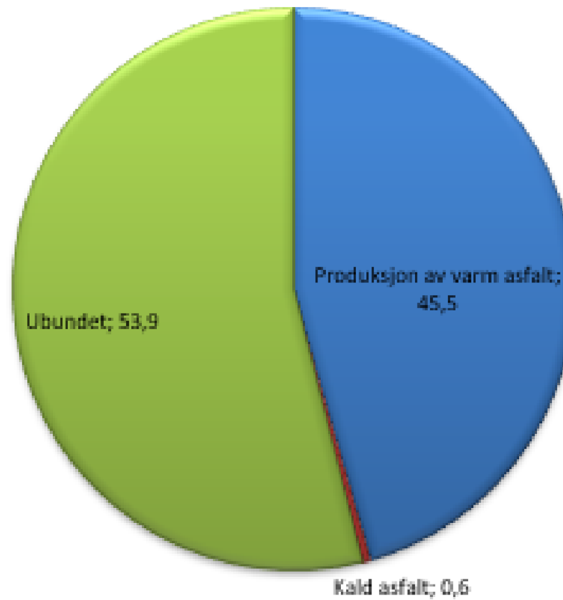
Figur 4. Fordeling av gjenvinningsanvendelser i 2021